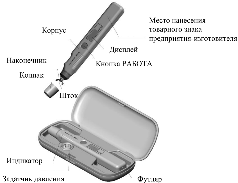
Рисунок 1 – Внешний вид индикатора ИГД-03