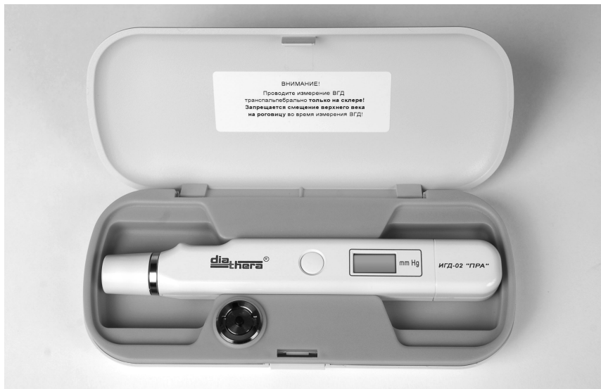
Рисунок 1 — Внешний вид индикатора в футляре

3.2 Внешний вид индикатора представлен на рисунке 1.